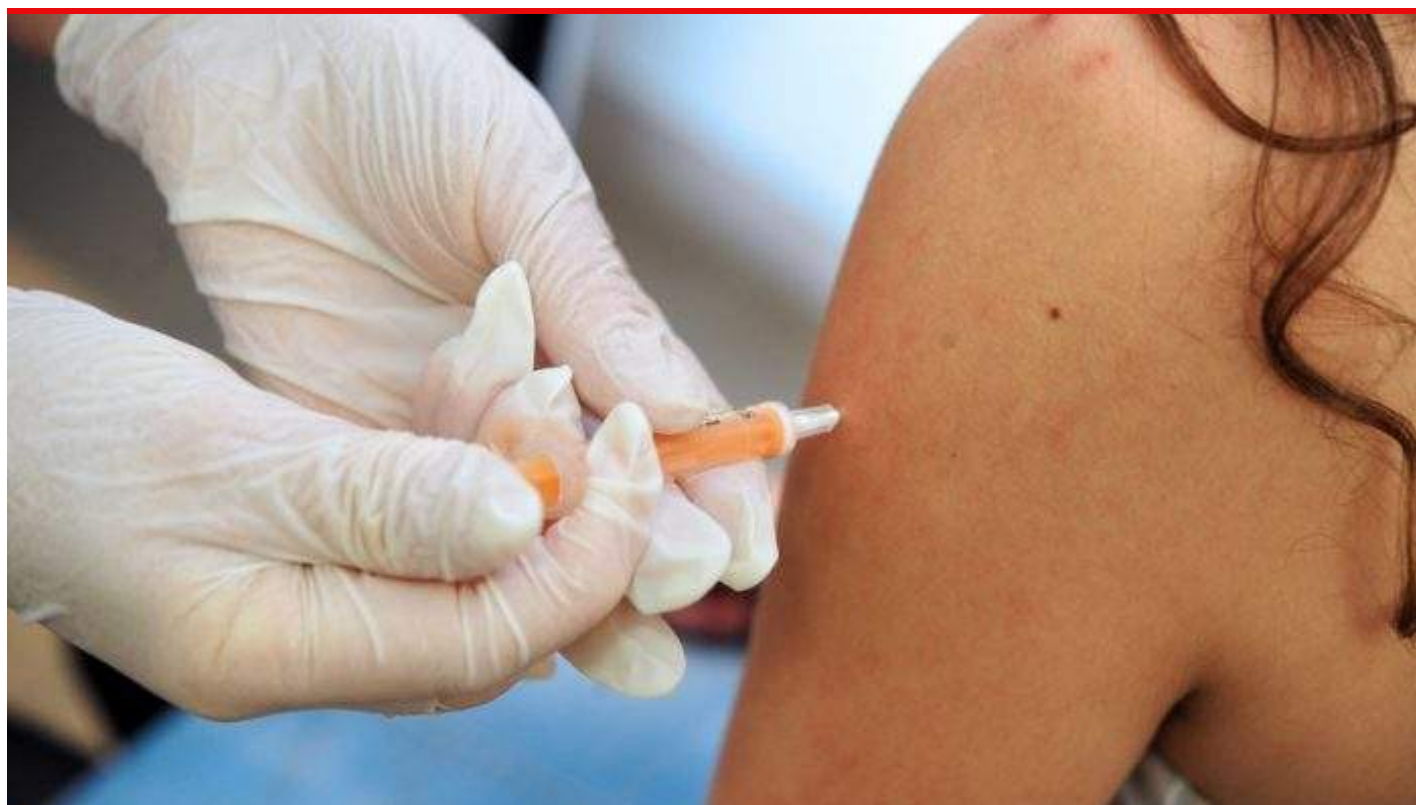
Le ministère de la Santé appelle à suivre normalement le calendrier de vaccination.